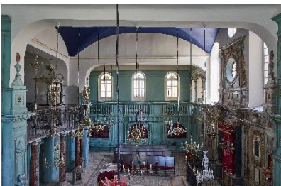
Synagogue de Carpentras.

Le Musée dauphinois propose une nouvelle exposition temporaire dédiée à la présence juive deux fois millénaires entre Rhône et Alpes. Dans un premier temps, historiens et archéologues partagent les résultats de leurs recherches les plus récentes. De courtes bandes dessinées offrent un regard synthétique sur la chronologie des temps de coexistence ou de rejet. Une création audio-phonique donne voix à de jeunes Grenoblois juifs qui témoignent de leurs sentiments d'appartenance au judaïsme en 2025. Les traditions, les fêtes, la gastronomie, la musique et la pop culture sont ainsi mises à l'honneur. Des illustrations originales facilitent la compréhension des pratiques qui se perpétuent encore aujourd'hui. Des ressources pédagogiques, regroupées dans un espace animé par deux médiateurs, sont mises à disposition des enseignants et des élèves.