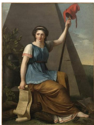
Nanine Vallain, La Liberté, 1794. Coll. Musée de la Révolution française - Département de l'Isère - Dépôt du musée du Louvre

du 27 juin au 23 novembre 2025 | Musée de la Révolution française – Domaine de Vizille